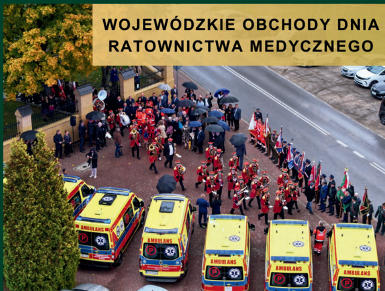
WOJEWÓDZKIE OBCHODY DNIA RATOWNICTWA MEDYCZNEGO