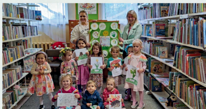
Lekcja biblioteczna „Wiosna, wiosna ach to ty” - dla młodszej grupy Przedszkolaków w SSP w Glinach Małych