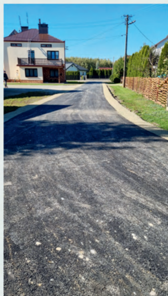
drogi w Borowej

Wykonano zadanie pn. „Przebudowa dróg działka ewid. nr 2217 i 2244 w miejscowości Borowa oraz remont drogi działka nr ewid. 327, 388/4, 1419 w miejscowości Górki”. Koszty realizacji wyniosły 159 420,30 zł, w tym z Funduszu Sołeckiego wsi Borowa w kwocie 39 356,40 zł oraz Funduszu Sołeckiego wsi Górki w kwocie 30 000 zł.