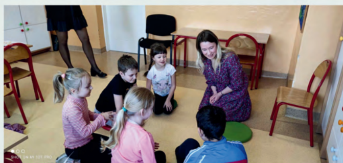
Lekcja biblioteczna „Życie i twórczość Doroty Gellner” w klasie 2 SSP Gliny Małe