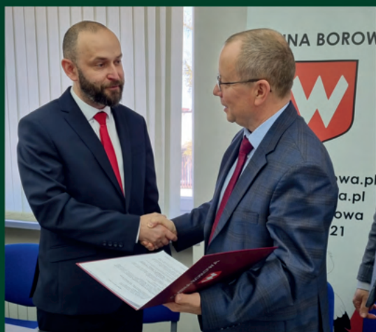
RUSZA BUDOWA HALI SPORTOWEJ