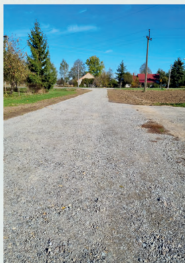
droga w Sadekowej Górze

Wykonano zadanie pn. „Modernizacja dróg działka nr ewid. 797 obręb Górki na długości 657 m i nr ewid. 637 obręb Sadekowa Góra na długości 60 m”. Koszty realizacji zadania wyniosły 159 618,33 zł, w tym dofinansowanie z funduszu wyłączenia gruntów z produkcji rolnej w kwocie 100 000 zł.