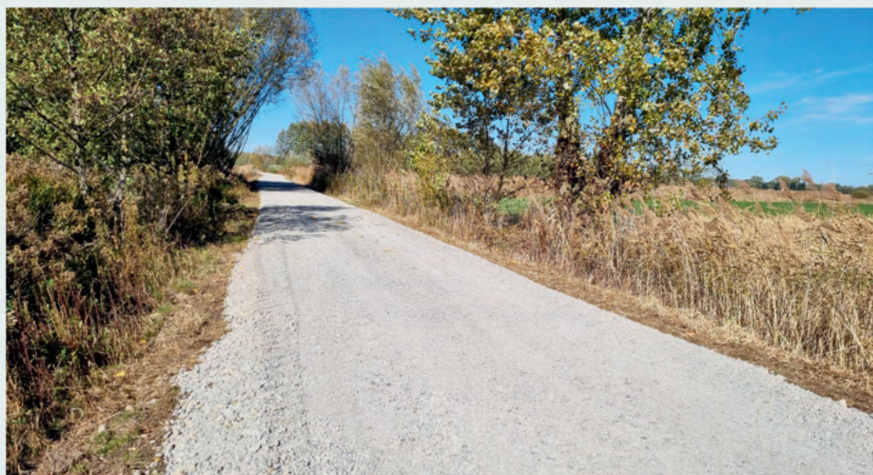
droga w Górkach

Wykonano zadanie pn. „Przebudowa dróg działka ewid. nr 2217 i 2244 w miejscowości Borowa oraz remont drogi działka nr ewid. 327, 388/4, 1419 w miejscowości Górki”. Koszty realizacji wyniosły 159 420,30 zł, w tym z Funduszu Sołeckiego wsi Borowa w kwocie 39 356,40 zł oraz Funduszu Sołeckiego wsi Górki w kwocie 30 000 zł.