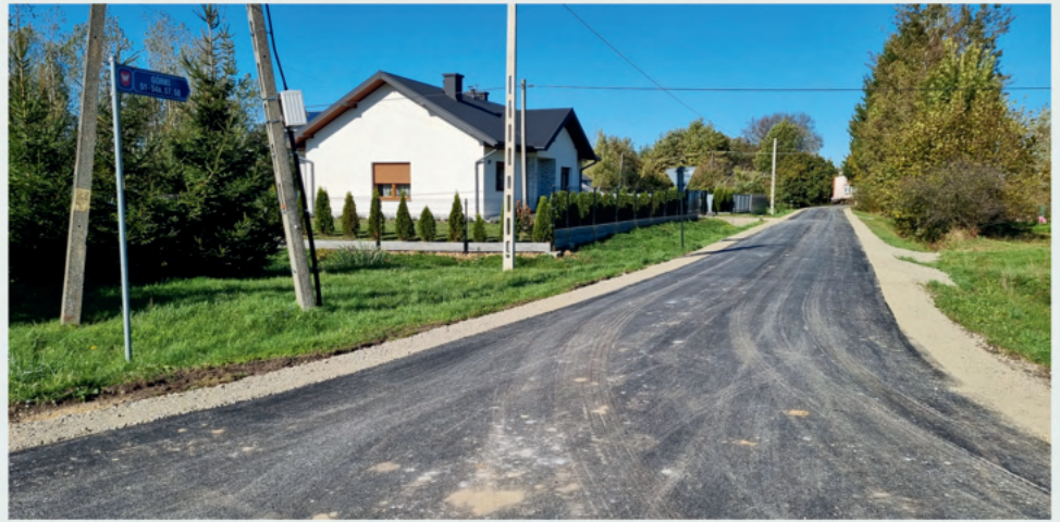
droga w Górkach