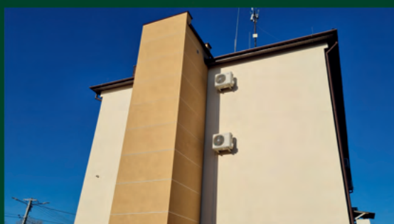
BUDOWA WINDY W BUDYNKU URZĘDU GMINY