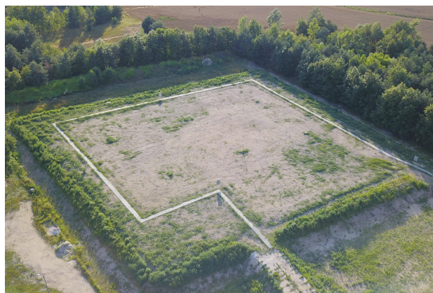
Wysypisko po rekultywacji

Tereny wokół zrehabilitowanego wysypiska należą do gminy i obejmują około 5 hektarów. 2 ha będą wydzielone pod budowę farmy fotowoltaicznej. Całość inwestycji ma zostać sfinansowana przez Firmę Enea Połaniec S.A. Włączając się w „zielone projekty”, oferujemy energetyce niewykorzystane przez rolnictwo grunty pod budowę wielkoobszarowych instalacji fotowoltaicznych. Dla Gminy Borowa inwestycja ta będzie kolejną z grup inwestycji, dzięki której stajemy się Gminą przyjazną środowisku.