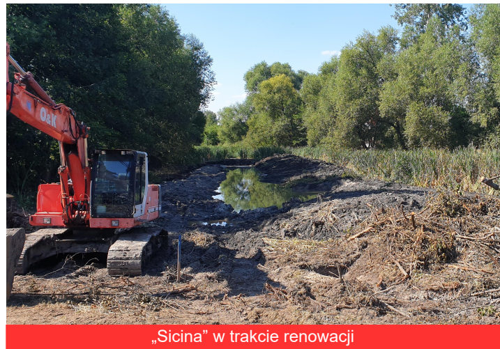
„Sicina” w trakcie renowacji

Zadaniem tego zbiornika jest zbieranie wód opadowych spływających z części wsi Borowa oraz pobliskich terenów rolniczych.