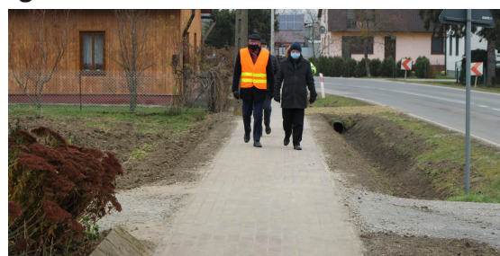
Odbiór zakończonych robót budowlanych

Chodniki w Pławie i Orłowie w ciągu drogi wojewódzkiej Sadkowa Góra – Mielec budowano kilkanaście lat temu. Obecnie ich stan wymagał pilnego remontu. Na wniosek Gminy Borowa ich remont został zrealizowany przez Podkarpacki Zarząd Dróg Wojewódzkich w Rzeszowie. Wartość wykonanego zadania - 142 800 zł z czego dofinansowanie Gminy - 42 800 zł (w Pławie oddany został wyremontowany odcinek chodnika o długości ok. 500 m , w Orłowie ok. 150 m ).