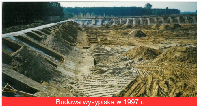
Budowa wysypiska w 1997 r.

Zakończyła się rekultywacja nieczynnego od kilku lat składowiska odpadów komunalnych w Borowej. Teraz na terenach wokół wysypiska jest w planach powstanie dużej, proekologicznej inwestycji - farmy fotowoltaicznej o mocy ok. 1 MW. Składowisko odpadów komunalnych w Borowej powstało w 1997 roku. Przez kilkanaście lat zwożono na nie śmieci z terenu gmin Borowa oraz Gawłuszowice i Czermin.