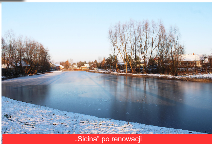
„Sicina” po renowacji

Zakres prac obejmował usunięcie trzciny i innych porostów z dna zbiornika, odmulenie dna zbiornika warstwą do głębokość 1 m na powierzchni 0,49 ha, skarpowanie czaszy zbiornika, wywóz zanieczyszczeń i urobku z odmulenia. Pierwszy etap inwestycji to koszt 169 997 zł (sfinansowany ze środków pochodzących z Urzędu Marszałkowskiego Województwa Podkarpackiego oraz z budżetu Gminy).