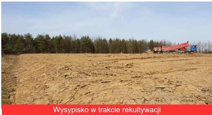
Wysypisko w trakcie rekultywacji

Zakończyła się rekultywacja nieczynnego od kilku lat składowiska odpadów komunalnych w Borowej. Teraz na terenach wokół wysypiska jest w planach powstanie dużej, proekologicznej inwestycji - farmy fotowoltaicznej o mocy ok. 1 MW. Składowisko odpadów komunalnych w Borowej powstało w 1997 roku. Przez kilkanaście lat zwożono na nie śmieci z terenu gmin Borowa oraz Gawłuszowice i Czermin.