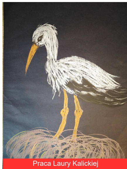
Praca Laury Kalickiej

Zachęcamy wszystkich czytelników do obserwowania naszej strony: facebook.com/GminaBorowa tam czekają na Państwa informacje o Naszej Gminie oraz konkursy.