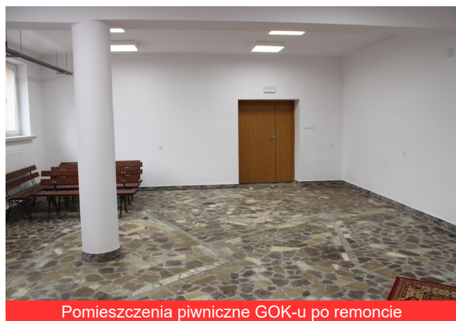
Pomieszczenia piwniczne GOK-u po remoncie

W październiku 2020 roku zakończyła się modernizacja dużej sali wraz z aneksem pomieszczeń piwnicznych budynku GOK w Borowej. Wykonano następujące prace: remont instalacji elektrycznej, roboty rozbiórkowe, roboty murarskie i tynkarskie, roboty posadzkowe, roboty stolarskie, roboty malarskie. Kwota dofinansowania wyniosła – 10 000 zł , łączny koszt przedsięwzięcia wyniósł – 28 736,07 zł .