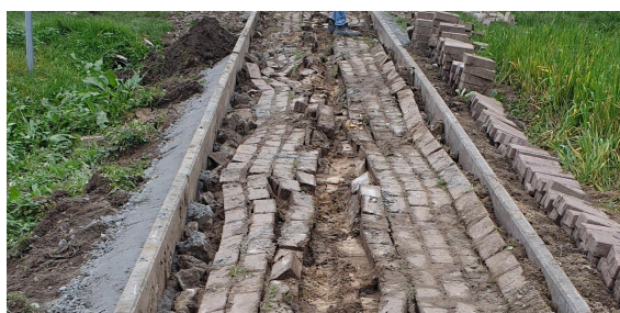
W trakcie budowy