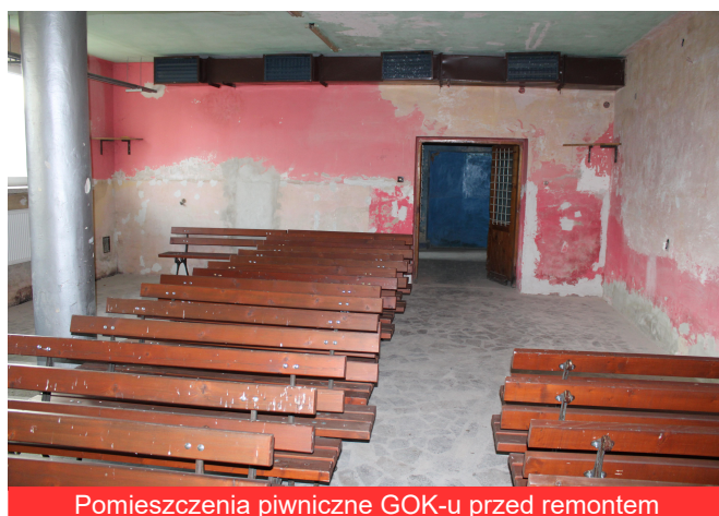
Pomieszczenia piwniczne GOK-u przed remontem

Grupa Odnowy Wsi realizowała zadanie na które został złożony wniosek do Urzędu Marszałkowskiego Województwa Podkarpackiego pod nazwą „Modernizacja, remont i organizacja pomieszczeń dla spotkań młodzieży, dzieci i dorosłych w pomieszczeniach piwnicznych budynku Gminnego Ośrodka Kultury w Borowej” - etap II. W 2020 r. kwota środków przeznaczonych z Budżetu Województwa Podkarpackiego na dofinansowanie zadań wynosiła 704 826,00 zł, co pozwoliło na podpisanie 71 umów z beneficjentami Podkarpackiego Programu Odnowy Wsi.