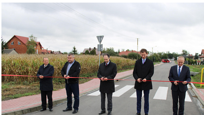
Uroczyste otwarcie dróg w centrum wsi Borowa

Jednym z najważniejszych zadań obecnej kadencji jest realizacja zadań inwestycyjnych gwarantujących stabilny rozwój naszej Gminy oraz poprawę warunków życia wszystkich jej mieszkańców, w tym rozbudowa i poprawa stanu technicznego sieci dróg.